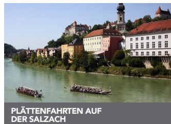
PLÄTTENFAHRTEN AUF DER SALZACH