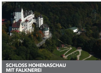
SCHLOSS HOHENASCHAU MIT FALKNEREI